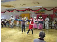
アロハ・ハワイアンズ レイカラ 様