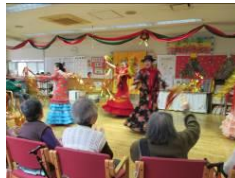
鶴見ラスガパス フラメンコスタジオ 様