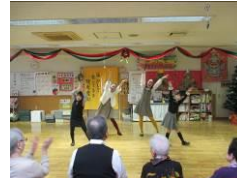
こども ミュージカル 様